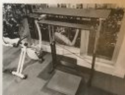
バランスマットやバランスボードに乗り、スタンダグスタで作業を行うスタンディングゾーン

ンの利用料金のほか、飲食やパーソナルトレーニングなど、施設内でのサービス利用料の支払いが可能である。パーソナルトレーニングについては、2か月間に90分のプログラムを6セット行う「スタンダード」・スタンダードにオンラインによる食事指導（30分）を加えた「スペシャル」の2コースがある。料金は前者が月額2万