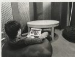
読み込みセッションを置いたコミュニティゾーンはイメージ作りがフレッシュに向く